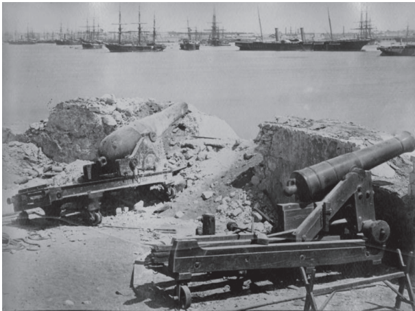
الأسطول الإنجليزي يستعد لتدمير الطابية.